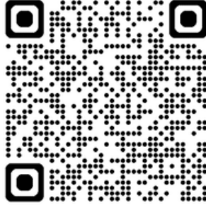
Türkiyede gezilebilecek 40 tarihi yer.