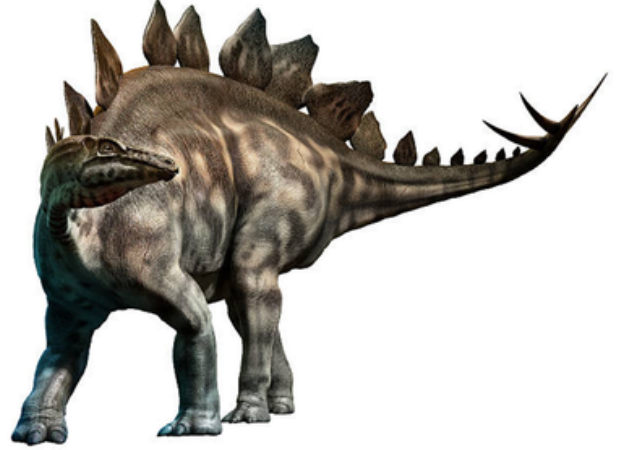
Stegosaurus: Sirtında büyük plakalar bulunur, otçuldur.