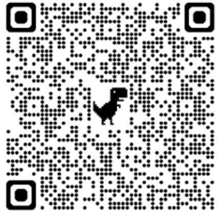
QR1- T Şeklinde sütunlar. Video.