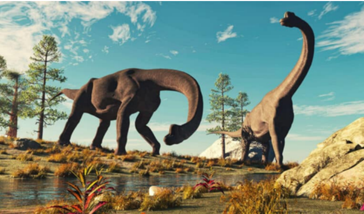
Brachiosaurus: Büyük, uzun boyunlu bir otobur dinozordu.