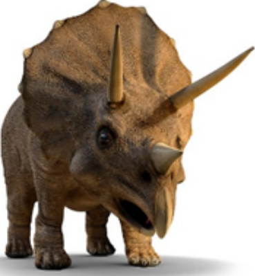
Triceratops: Üç boynuzu vardır, bitkilerle beslenirdi.